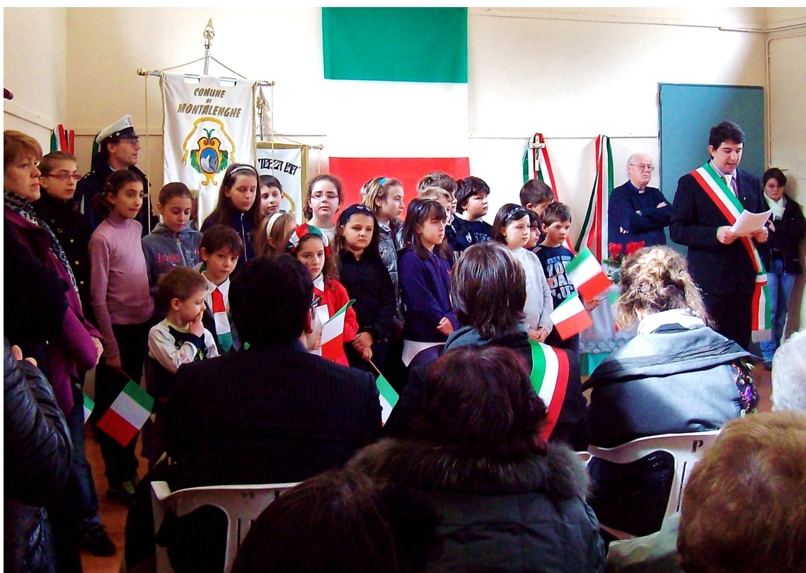
Un momento della celebrazione, mentre il Sindaco legge il discorso commemorativo in presenza degli alunni della scuola elementare Sandro Pertini.

Il taglio del nastro e la benedizione della targa viaria hanno chiuso questa seconda parte della manifestazione. La ProLoco di Montalenghe ha allestito il gradito rinfresco conclusivo.